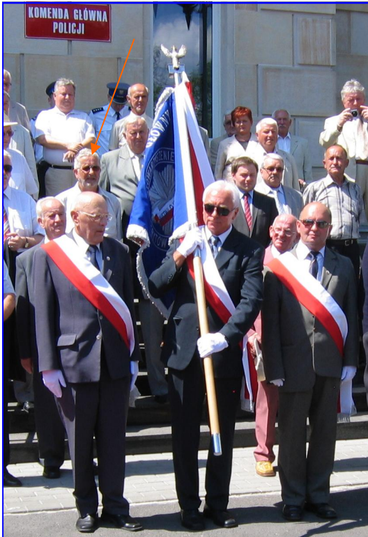
Poczet sztandarowy ZG SEiRP